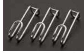
ハンドピースハンガー (3個)