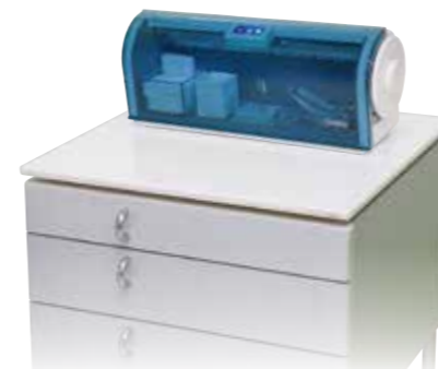
キャビネットの上にも