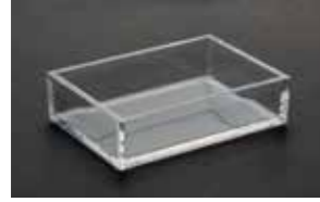
ハンドピースボックス (1個)