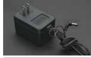
専用ACアダプター (1個) ※形状は多少変更になる場合があります。