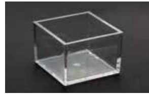
ワッテガーゼボックス (1個)