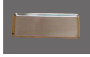
専用ステンレストレー (1枚)