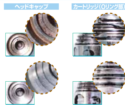
協力K 歯科医院・Y 歯科医院